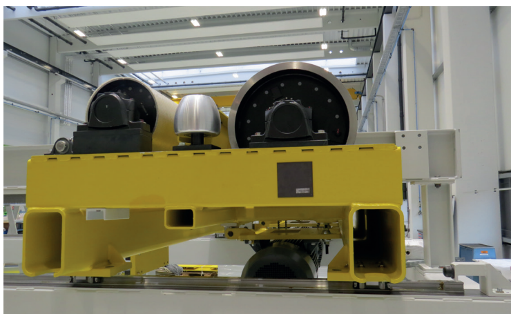
Links: freie Laufrolle